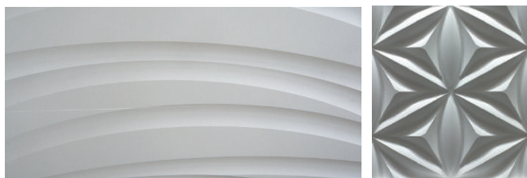
特注デザイン・レリーフパネル