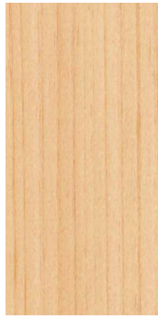
1/1 スケール 30mm×60mm