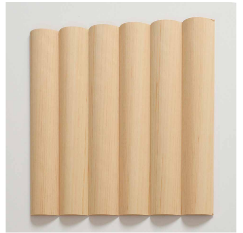
70-E タイプ 300mm×300mm

価格はカタログ記載の突板仕上げ対応品 (Eタイプ・D+Eタイプ・M+EMRタイプなど) から 1割UP