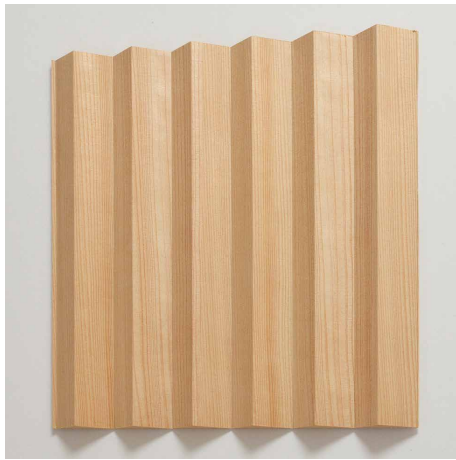
68-E タイプ 300mm×300mm