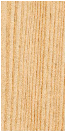
1/1 スケール 30mm×60mm